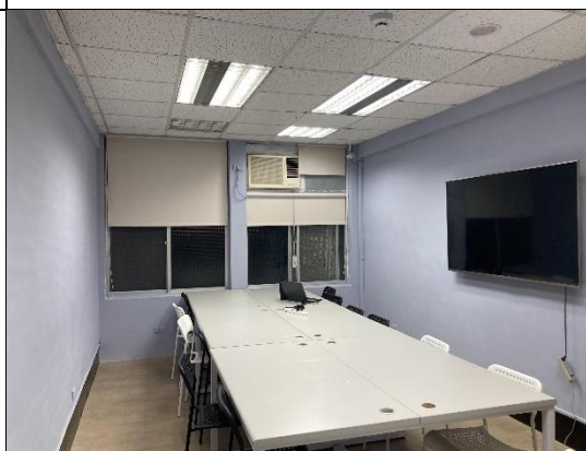
202 小型會議室 A