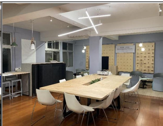
203 共創空間 B