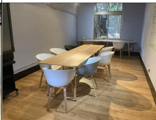
209 小型會議室 B