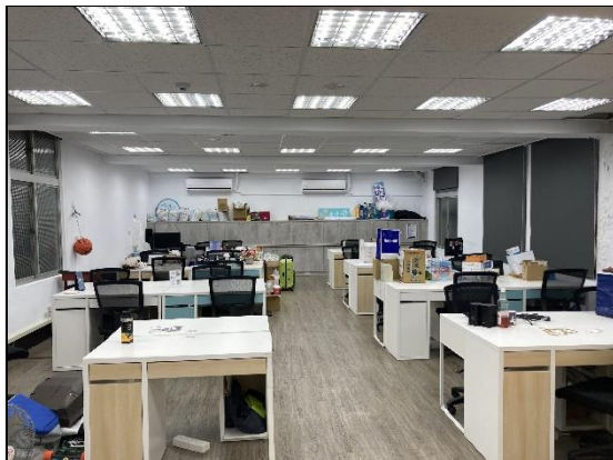
201 共同工作空間 A