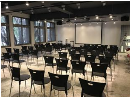
208 大型會議室 B