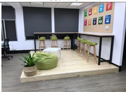
201 共同工作空間 A