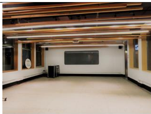
107 大型會議室 A 21坪